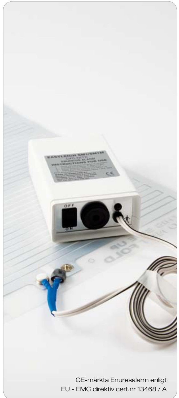
CE-märkta Enuresalarm enligt EU - EMC direktiv cert.nr 13468 / A

Typ SM3, enkel plast baserad matta. 54 x 42 cm. Hållbarhet ca 6-8 veckor